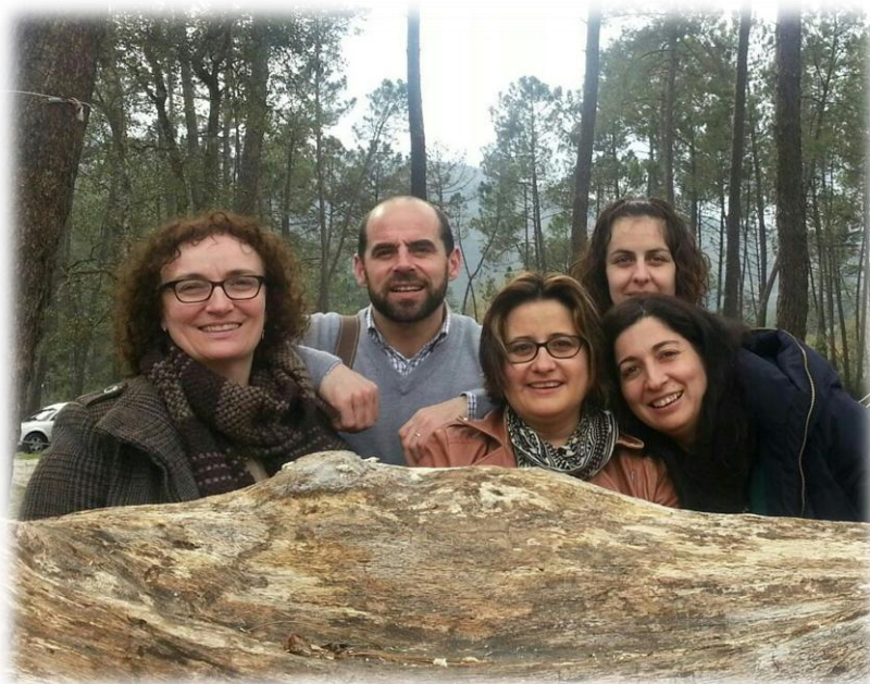
Equipo del programa de mayores

81 mayores han participado en las actividades de envejecimiento activo