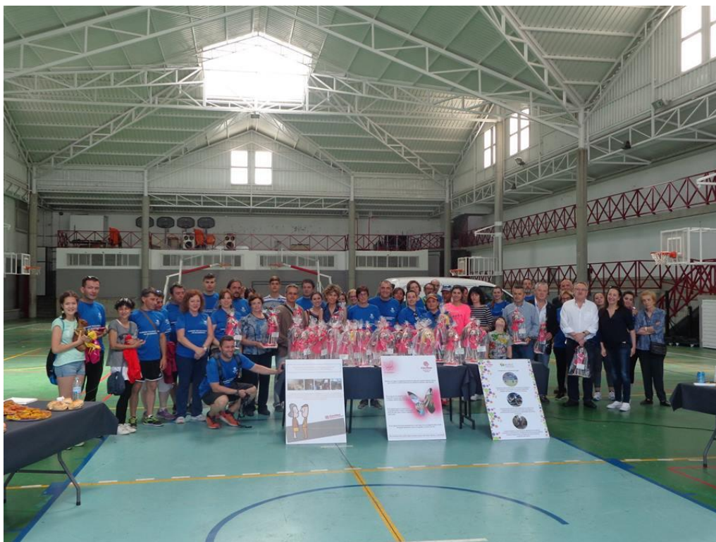
II ANDAINA SOLIDARIA. 12 Junio de 2016.

Por ello no desaprovechamos ninguna ocasión para invitar a toda la sociedad a que sumen esfuerzos por un futuro mejor.