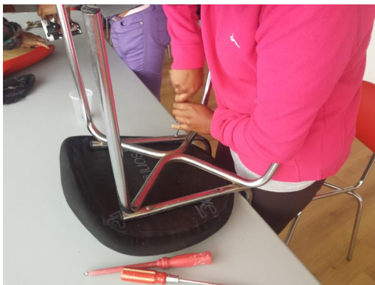
Taller de tapizado. Primer semestre de 2016.

Cáritas en Ourense desarrolla desde 1.999 un dispositivo, el programa “ALUMAR” que cuenta con tres recursos ( Unidad móvil, vivienda de acogida y centro de día ) para acompañar a mujeres que se encuentran vinculadas a los contextos de prostitución. Tratamos de facilitar además de la información y del asesoramiento necesario, acciones formativas encaminadas a su propia inclusión social activa. Hemos trabajado con 57 mujeres, de las cuales 22 se integraron en distintas acciones formativas .